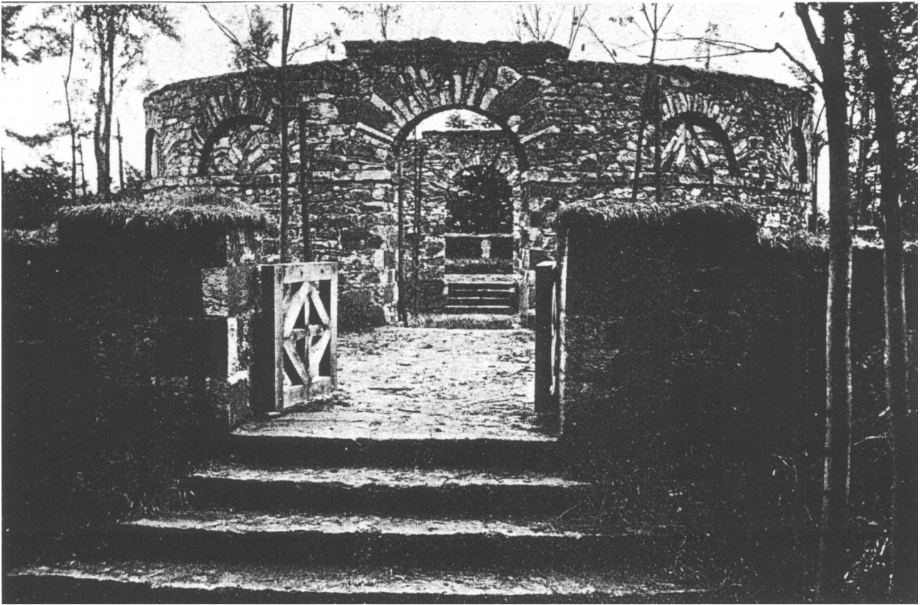
Rotonde du cimetière militaire d’Anloy-Bruyères, dans son aspect originel.

Le cimetière militaire franco – allemand d’Anloy-Bruyères: Abordons les différences entre le cimetière créé en 1914 et celui d’aujourd’hui.