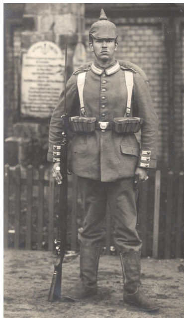
Soldat allemand avec le fusil Mauser Gewehr 1898.

Les principales armes françaises et allemandes en 1914 : Performances et rôles des armes durant le combat.