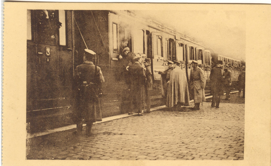
Blessés français embarquant en gare de Poix Saint-Hubert pour l'Allemagne.

Les victimes militaires du combat d'Anloy : Le combat d'Anloy fait 1750 morts et de nombreux blessés.