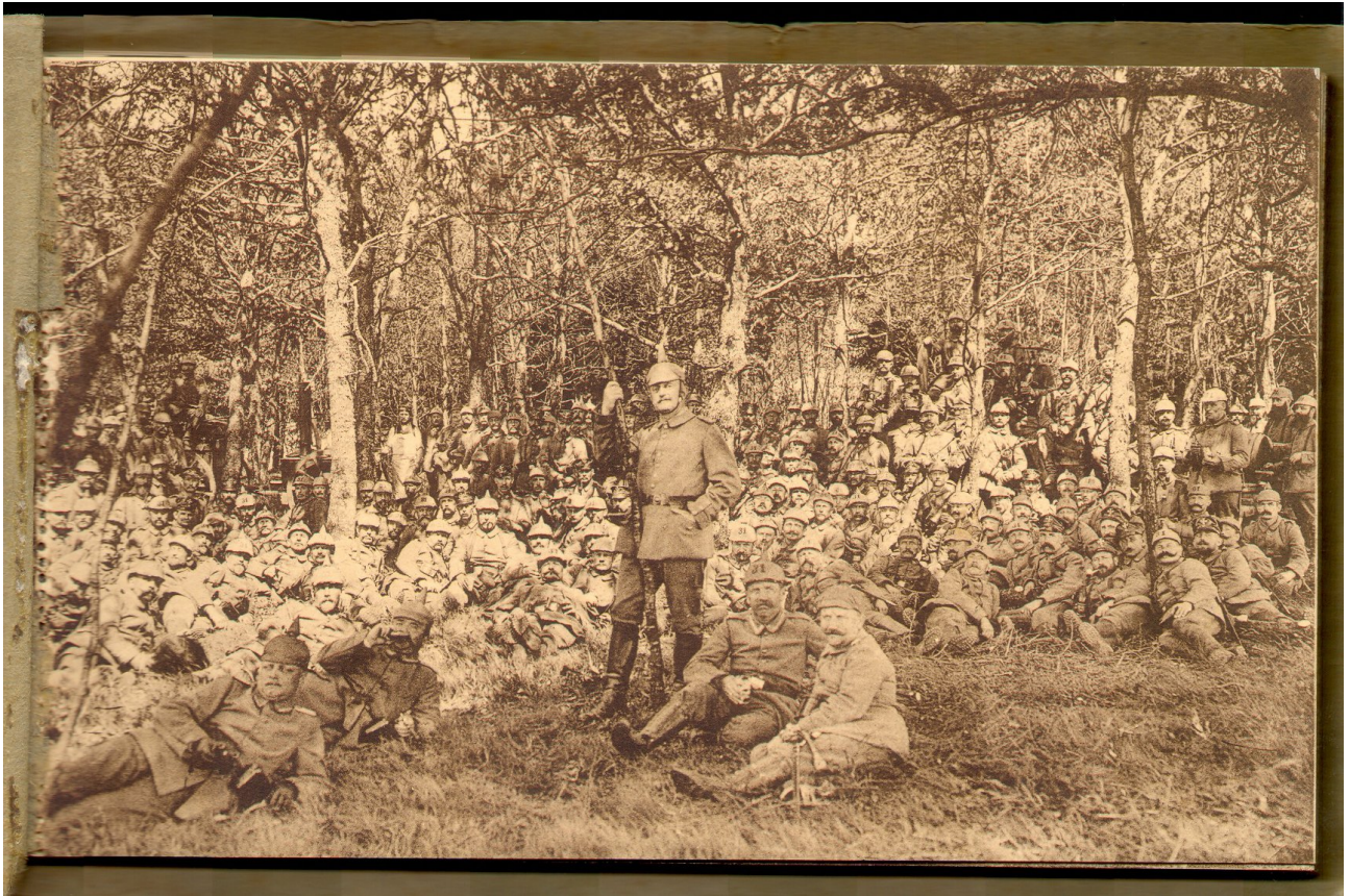
Soldats allemands engagés à la bataille de Bertrix.

Le combat d'Anloy – 22 août 1914 : Quels sont les enjeux et le déroulé du combat ?